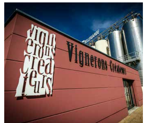
Propos recueillis par L. Thierion

Par le passé, nous avions uniquement une appréciation globale de la parcelle que nous retranscrivions sur papier ou tableaux Excel. Aujourd'hui, la précision des observations et des interventions qui en découlent nous permet d'être classés et donc mieux rémunérés au regard de nos méthodes et pratiques.